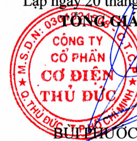
BÙI PHƯỚC QUẢNG